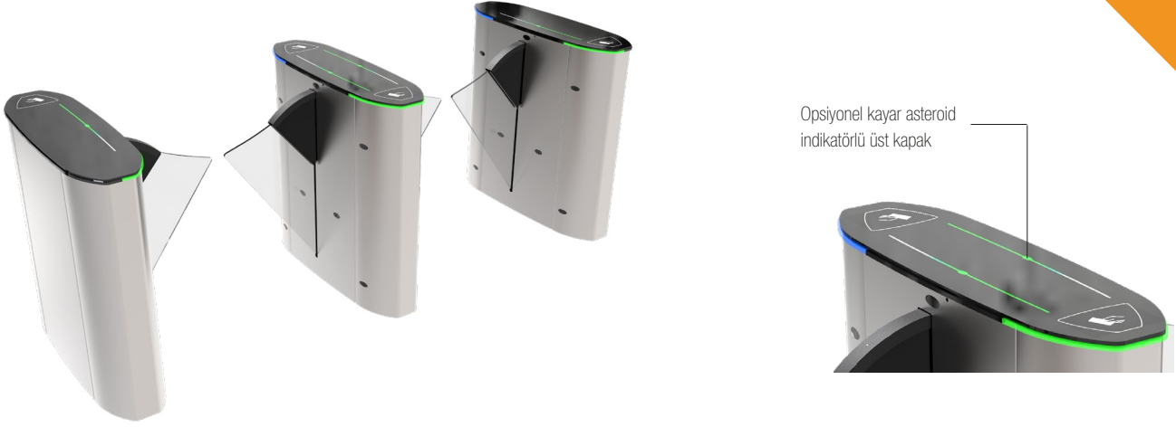
Opsiyonel kayar asteroid indikatörü üst kapak